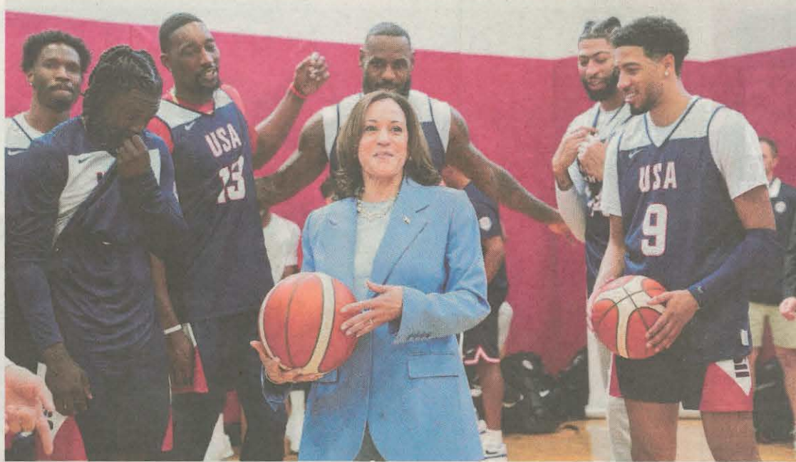
Dúshlán nua: Leas-Uachtarán Mheiriceá agus iarrthóir nua na nDaonlathach Kamala Harris le foireann cispheile SAM an mhí seo agus iad ag déanamh réidh le dul chuig na Cluichí Oilimpeacha

"Ní raibh an cumas ag Biden é sin a dhéanamh, faoi mar a bhí rudai."